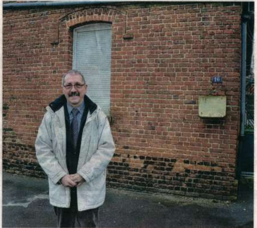
La mairie a acquis cette propriété plus connue sous le nom de la maison « Cadart » pour en faire une Maison pour tous.

Au chapitre de la sécurité, un radar pédagogique sera installé sur la voie où la circulation est la plus dense. Probablement dans la rue de l'Église ou de la Rose. Un autre devrait également fleurir sur la RD 643 dans le sens Douai Bugnicourt. ■