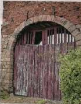
L'ancienne bergerie du XVII e siècle se situe rue de la Rose.

certaines des bâtiments existants pour maintenir le côté exceptionnel du bâti. » D'autres, trop vétustes, ont déjà été démolis. Montant du projet, 1,2 million d'euros financé par l'EPF, Habitat du Nord, et le PACT.