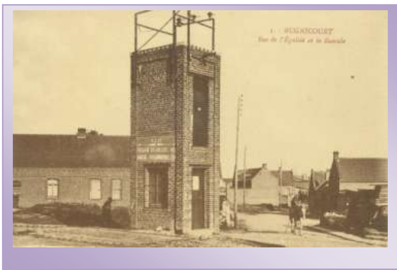
Rue de l'Egalité « ancien transformateur »