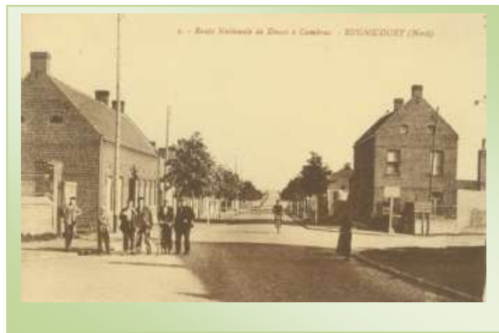
La Route Nationale