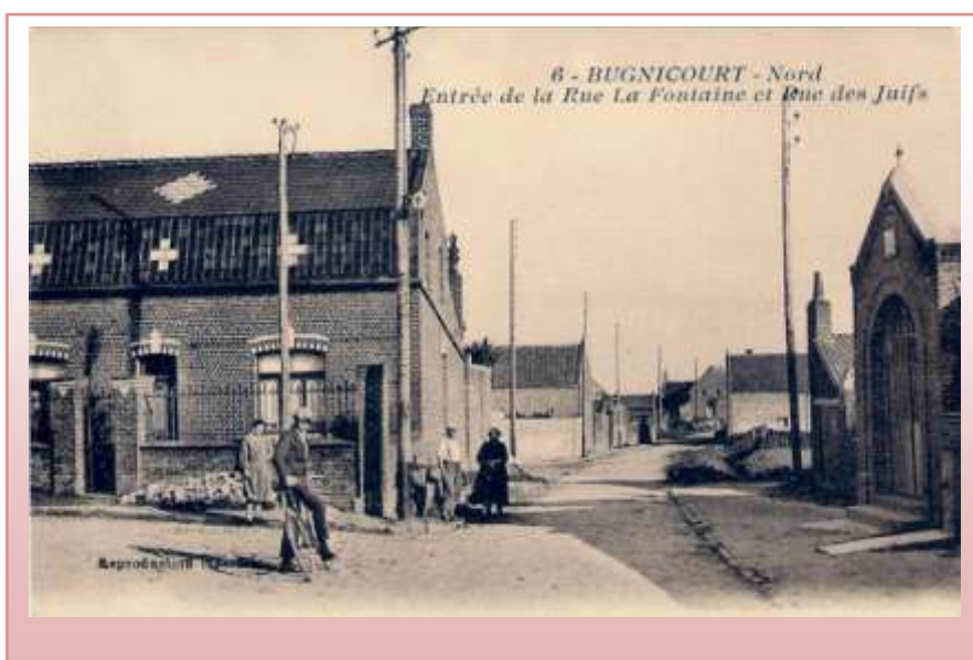
Rue de la Fontaine et rue des Juifs