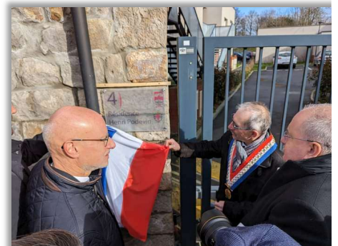
La résidence Henri Podevin

Bravo à toutes celles et ceux qui ont contribué à l'aboutissement de ces projets amorcés il y a plusieurs années.